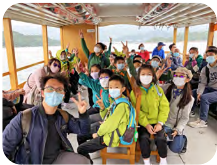
▲大家在街渡上都急不及待了