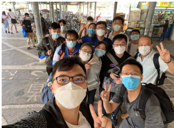
All students and teachers getting ready at the Mui Wo Pier