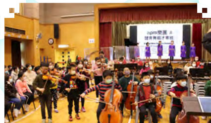
▲ apm樂團及體育舞蹈才華班以El Tango帶領大家舞出活力又喜樂的聖誕響宴