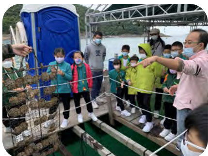
▲原來珍珠貝是被吊在籠網內養殖的