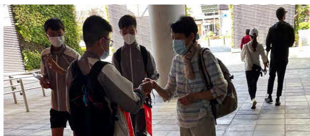
Thank you for supporting Community Chest Flag Day 2021!

On 20th November, while some were still enjoying the term break, a myriad of my schoolmates and I participated in the Community Chest Flag Day 2021 as volunteers.