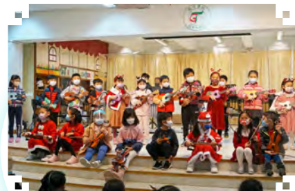
▲ Ukulele小吉他及小提琴才華班的同學為聖誕響宴揭開序幕