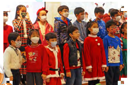
▲ Sing1Sing與台下觀眾歡欣地合唱 Always Sing Your Song