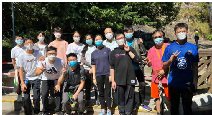
The group standing right in front of the Silvermine Waterfall