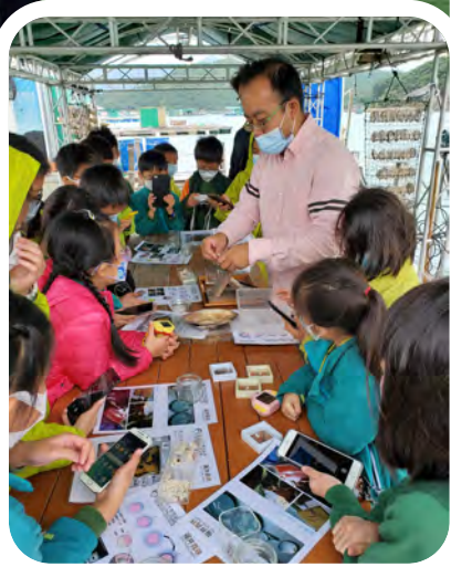
▲大家專心地聽負責人的科普知識講解