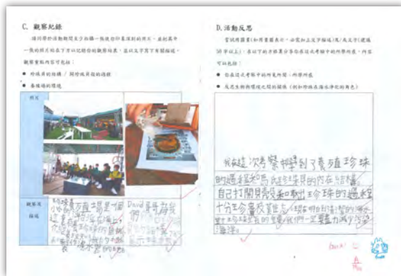
▲學生優秀作品 - 邢維逸 (3B)