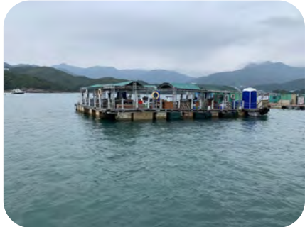
▲海上珍珠養殖場的外觀