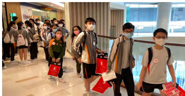
G.T. students involving in all sorts of volunteer work