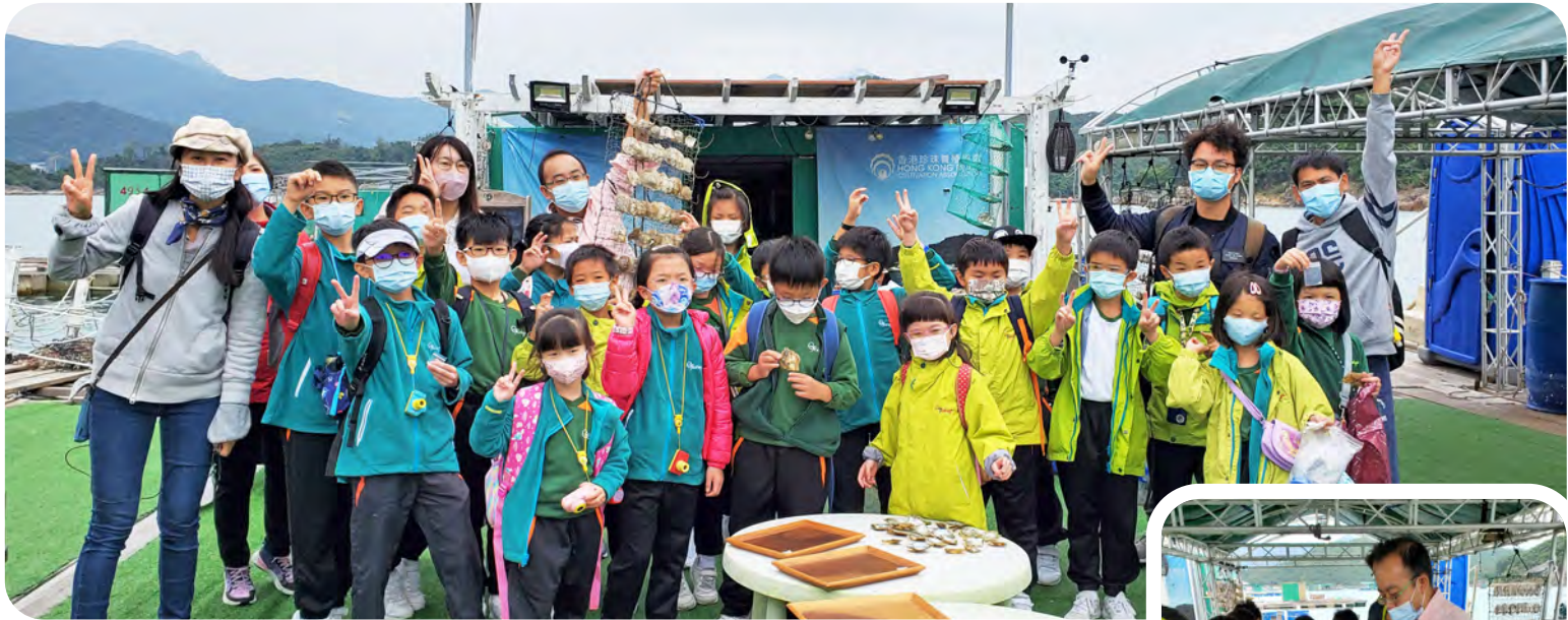
▲所有師生親身體驗開採珍珠，好興奮啊

一說起珍珠，不少同學都會聯想起珍珠奶茶裡的珍珠，又黑又圓又美味。不過大家知道真正的珍珠是怎樣形成的嗎？是不是所有貝類都可養殖珍珠呢？作為「STEAM任我闖」資優班的學生真幸福，有機會親身在海面上開貝取珠，認識何謂真正的珍珠。