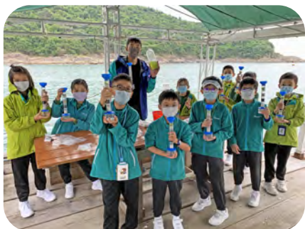
▲同學自製濾水柱去了解人工濾水的過程及原理