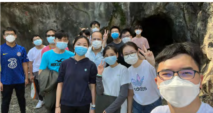
Silvermine Bay Cave was once a place of Hong Kong's silver production!