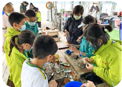
▲同學們都小心翼翼地開珍珠貝找尋屬於自己的寶物