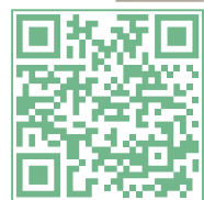
▲珍珠科普學堂活動回顧