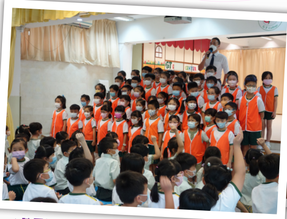
▲陳署校勉勵一眾初小領袖生