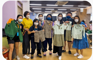
▲欣賞一班義工家長在校服回收活動的付出，用心整理好校服，好讓家長選擇