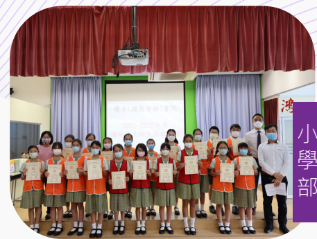
▲六年級領袖生，「橙中四點紅」，穿上紅色制服的隊長矚目全場