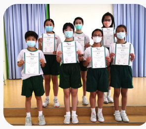
▲6C班獲得卓越成績的同學