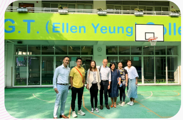
▲二年級的班代表在早餐會愉快暢談後，在校園拍照留念