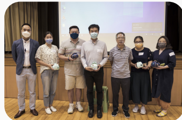
▲恭喜在kahoot 遊戲勝出的得獎家長