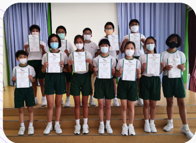
▲6B班獲得卓越成績的同學