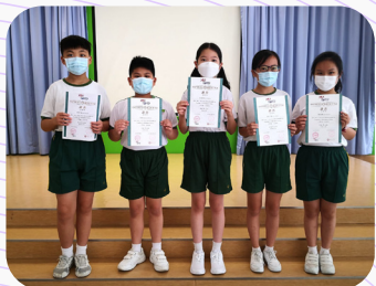
▲6A班獲得卓越成績的同學