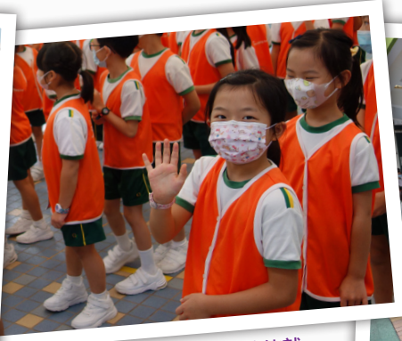
▲初小領袖生十分雀躍，等待就職典禮開始