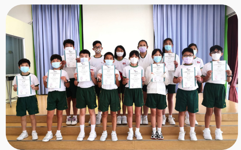
▲6D班獲得卓越成績的同學

「GAPSK 普通話水平考試」由北京大學語文教育研究所研發，是唯一獲得國家教育部港澳台辦公室批辦的中小學及幼稚園普通話水平考試，2004年開始在港舉辦考試。我校是最早參與考試的學校之一，從2007年至今，總共有15屆學生參加了這項考試。不但如此，我校學生的成績也節節攀升，近四年，獲得卓越及優良以上成績的學生佔每年參考人數的94%至100%，這一方面顯示出我校學生的普通話已達至很高水平，也體現了我校普教中工作的成效。展望未來，希望同學們繼續努力，爭取佳績！讓我們一起祝賀今年考獲卓越成績的同學們吧！