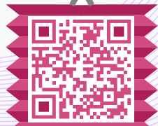
▲中秋攝影比賽 佳作欣賞