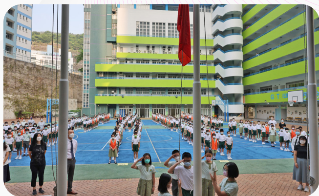
▲將軍澳校舍，同學們排列整齊，注視着國旗緩緩升起