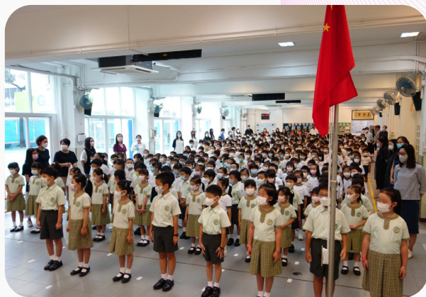
▲旺角校舍，一到三年級同學在升旗中表現非常認真