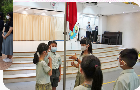
▲旺角校舍，升旗隊同學在國歌聲中將國旗緩緩升起

慶祝中華人民共和國成立七十二週年，本校師生於9月30日，在旺角校舍和將軍澳校舍分別進行了莊嚴的升旗儀式。本次的升旗手來自三年級（旺角校舍）和四年級（將軍澳校舍）。他們雖然年紀不大，卻都做到了步伐整齊一致，動作標準大方，很好地展現了優才學生應有的氣質。其餘同學也都認真對待，以專注的眼神看着國旗緩緩升起，值得稱讚。甚至在升旗儀式結束以後，更有同學看着國旗做起了升旗的動作，模仿升旗，實在是難能可貴。我們相信，這是兩場成功的升旗儀式，更是兩堂精彩的國民教育課。