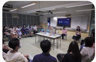
▲家長在教室跟班主任及各科任老師見面，互相認識及了解孩子的校園生活