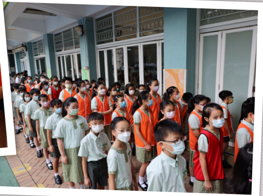
▲高小領袖生和班長耐心在外列隊，等待接受委任