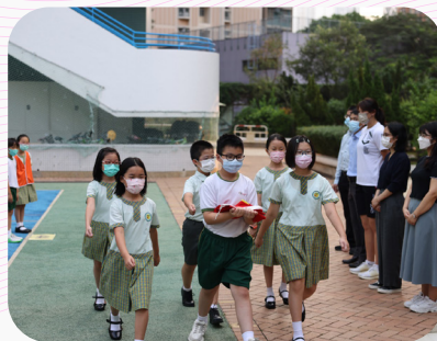
▲將軍澳校舍，升旗隊同學手捧國旗齊步出場，準備升旗