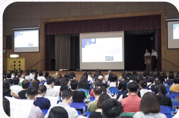
▲孩子要學習，家長也一起學習，大家都留心聆聽教授的分享