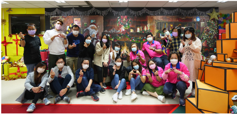
▲與各義工於聖雅各長者中心，「幸福聖誕屋」現場拍照留念

今年，本校再度參與由「築·動力」主辦的「幸福聖誕屋」，繼去年在優才旺角校舍舉行後，今年在「聖雅各蘇屋長者鄰舍中心」舉行，因為疫情，今年的活動以特別的4R拍攝形式於線上舉行；另外，展覽亦歡迎長者預約現場參觀。