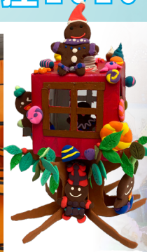
▲冠軍 邱灝晴 (1B)