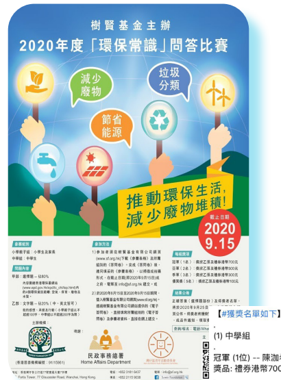
▲ The poster of the quiz competition