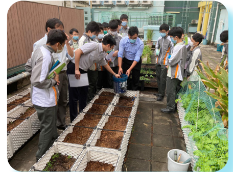
▲ Mr. Chan, Mr. Tam and Mr. Ng explaining the treatment of organic fertilisers and soil