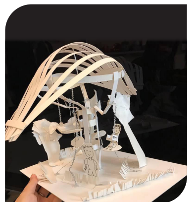
▲賴沛晴(6D) Gazebo: The legendary mushroom