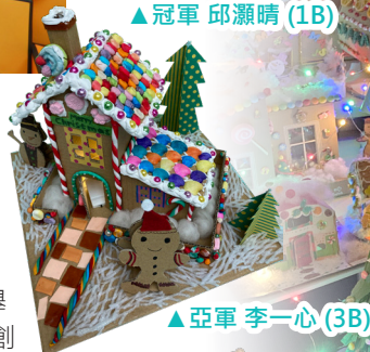
▲亞軍 李一心 (3B)