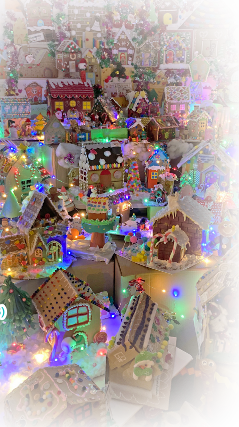
▲優才過百個家庭合力組成的聖誕村